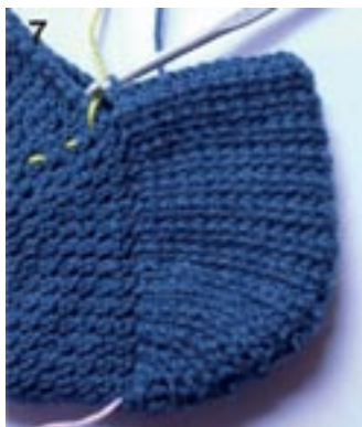
7: Færdig hæl. Øverst ses sidste rk i f-fm mellem markeringer B og A.

Slut sidste rk ved markering B. Hækl sidste m og den hvilende m/løkke sammen ved markering B. Hækl herefter f-fm fra markering B til markering A (= ved begyndelse af omg).