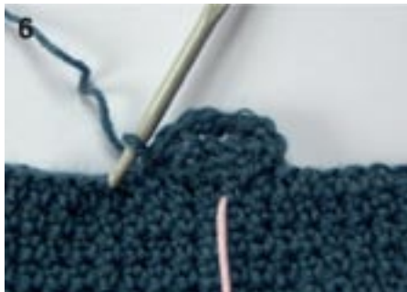
6: Hælen første 2 rækker. Den rosa tråd markerer basis-rk og hælen midt bag.

3.rk og alle følgende rk: Fortsæt udtagninger ved at hække 2 m i henholdsvis første og sidste m, 1 km i næste m på basis-rk, vend. Tag ud på denne måde indtil det givne maskeantal i tabellen til den valgte str.