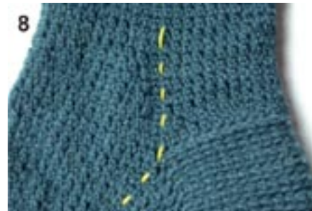
8: Indtagninger i overgangen mellem hæl og skaft.

Hækl herefter indtagninger som anvist i tabellen til den valgte størrelse. Først hækles indtagninger på hver side af markeringer = 4 indt på omg. Derefter hækles yderligere et antal indt, kun på fodens overside efter tabellen (= 2 indt på omg), indtil maskeantallet stemmer med tabellen.