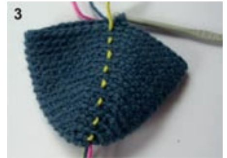
3: Færdig hæklet tå set fra siden, der er hæklet fm i bagerste maskelænke. De forreste maskelænker ligger som fine vandrette linjer på retsiden. Markeringer er trukket med op under hækling.