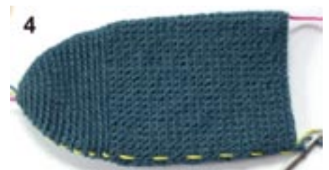
4: Tåen med afsnit A, samt fodens overside og sål uden udtagninger.

Fodens overside og sål hækles i to afsnit A og B (se foto 4 og 5): Afsnit A fra tåens begyndelse med udtagninger og afsnit B med regelmæssige udtagninger til hæl. Afsnit A (foto 4) er vist med f-fm hæklet lige op rundt i omg indtil den ønskede længde, eller som angivet i tabellen til den valgte størrelse. Bibehold og træk markeringer med op under hæklingen.