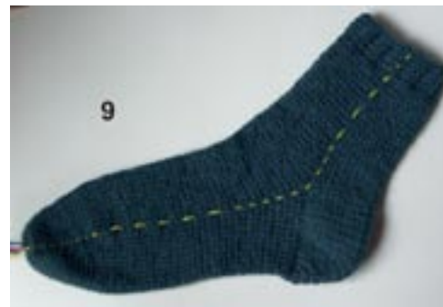
9: Færdig strømpe, med markeringer trukket med op under hækling.

Bryd garnet. Fjern alle markeringstråde og hæft alle tråde.