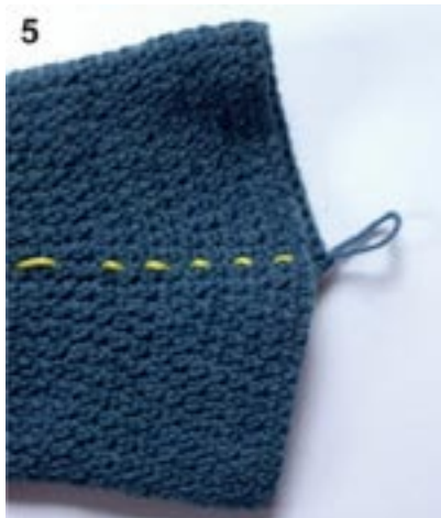
5: Afsnit B (med den lige markering af kontrast-tråd, trukket med op for hver omg), den hvilende m/løkke venter til senere.